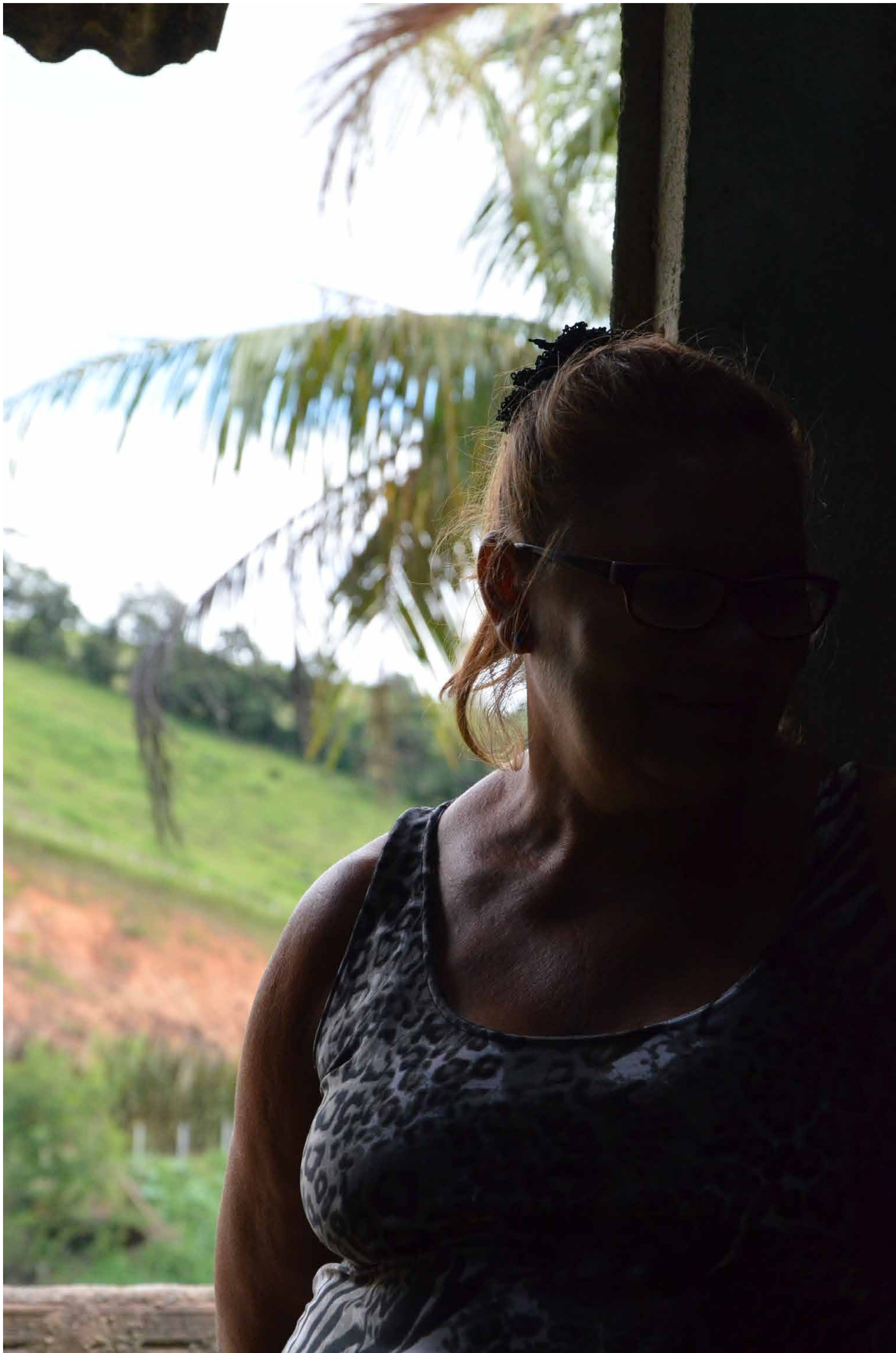
Belém de Maria/PE