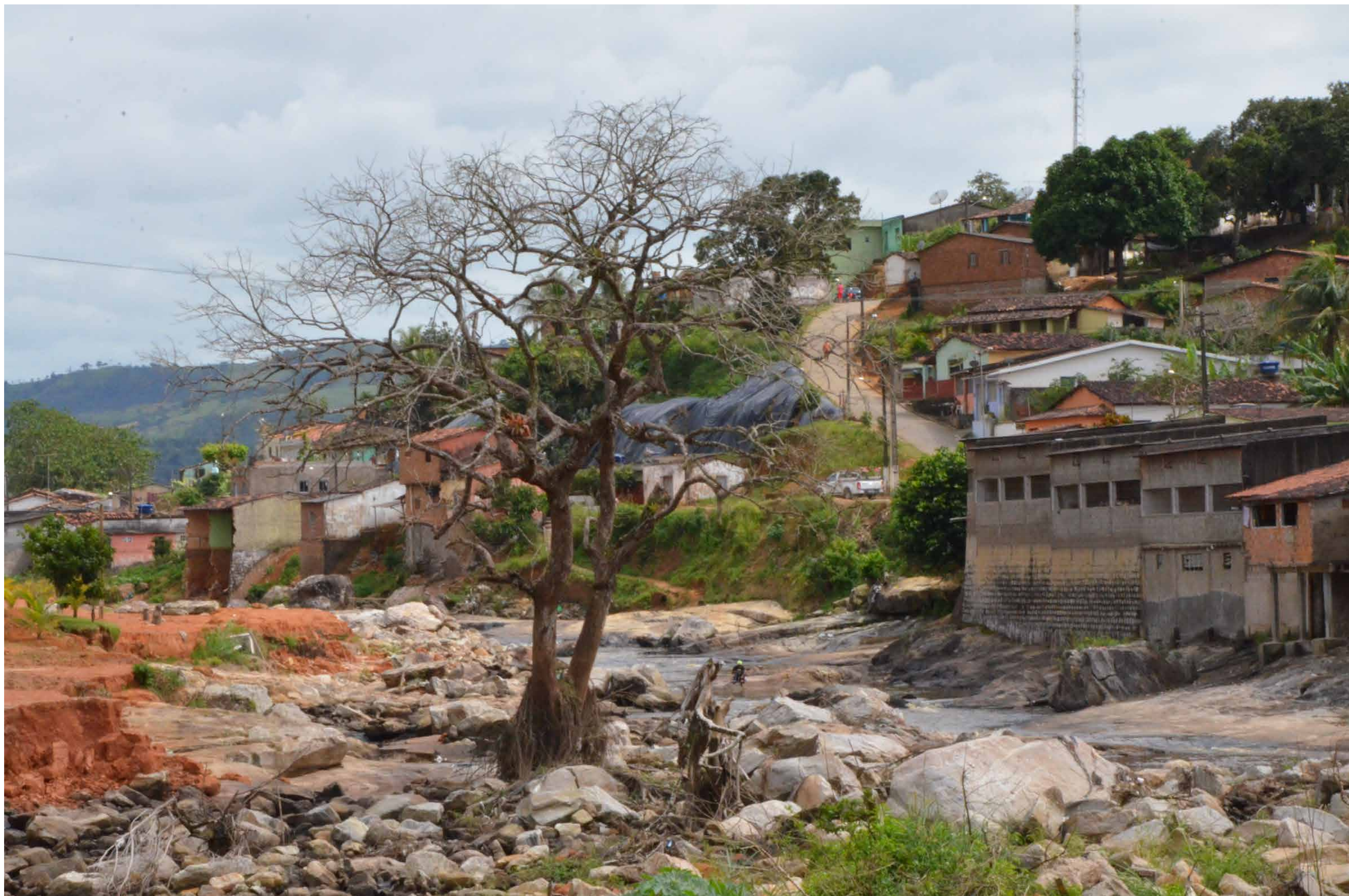
Belém de Maria/PE